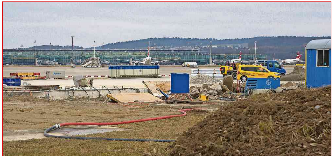
Aus betrieblichen sowie sicherheitsrelevanten Gründen werden am Flughafen Zürich einige Bau- und Unterhaltsarbeiten nicht tagsüber durchgeführt.

Im Zusammenhang mit dem Bau des neuen Dock A werden während des gesamten Jahres auf dem Vorfeld bei den Hotel-Standplätzen, nördlich des bestehenden Docks A, und beim Taxiway