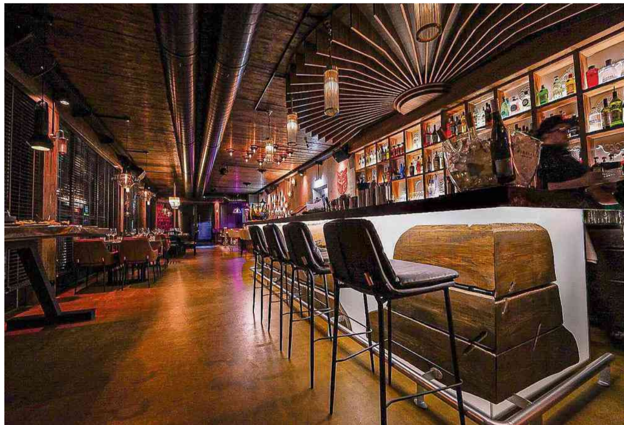
Neuer Genuss in Rümlang: Búho Rooftop Bar & Eatery mit dem gewissen Ambiente.

Hoch oben im dritten Stock fühlt sich der Gast in der ganz besonderen Atmosphäre sogleich willkommen. Die elegante, geschmackvolle Bar, dessen Interieur von viel warmem Holz und indirekter, dezenter Beleuchtung dominiert wird, bietet Raum für rund 60 Sitzplätze. Zwei grosse, originell gestaltete Terrassen laden bei schönem Wetter ab Frühling zu unvergesslichen Abenden im Kreise von Freunden und Bekannten ein, traumhafte Aus-