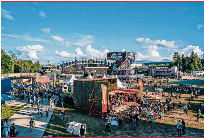
Das Zürich Openair findet dieses Jahr nicht statt, doch kehrt es 2027 mit einem erweiterten Besuchererlebnis zurück.

Die Daten für das Zürich Openair 2027 werden so bald wie möglich kommuniziert, wie es in der Medienmitteilung heisst. (pm)